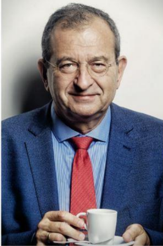
„Byl jsem vždycky opatrným optimistou, optimismus je moje životní nastavení.“

nec posun k levicovému liberalismu. U nás je ten proces obrácený. Nejprve nastoupil ekonomický socialismus a sociální stát a teprve posléze se sem přitáhly ideologie typu feminizmu, LGBT, politické korektnosti. Tyto nové „-ismy“ do jisté míry vyvolávají atmosféru, kterou jsme zažili už za komunistů. Když se tehdy v hospodě vykládaly anekdoty, tak se lidé pro jistotu ohlíželi, jestli je někdo neposlouchá. Zažil jsem něco podobného, když jsem v Americe jednomu americkému kolegovi vyprávěl vtípy o blondýnách. On se začal ohlížet podobně jako my tady v sedmdesátých letech. Říkal jsem mu: Co se bojíš, a on ať neblázním, co kdyby nás někdo slyšel... Já jsem si v tu chvíli uvědomil hloubku problému moderní doby. Spojené státy byly vždy na vývěsním štítu principů osobní svobody a toho, po čem člověk s naší totalitní zkušeností celý život toužil a o čem snil, že by mohl jednou žít. A najednou se tam člověk chvílemi cítí jako na pionýrském táboře.